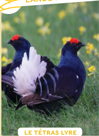
LE TÉTRAS LYRE