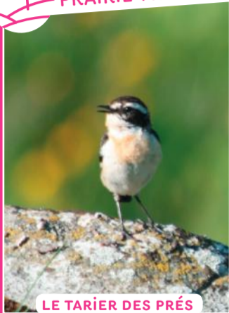
LE TARIER DES PRÉS