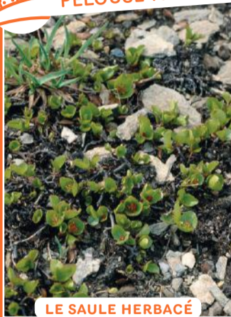
LE SAULE HERBACÉ