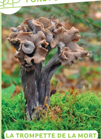
LA TROMPETTE DE LA MORT