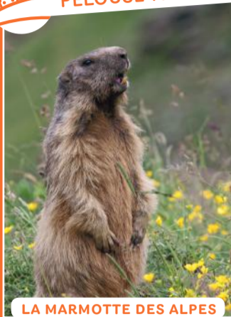
LA MARMOTTE DES ALPES