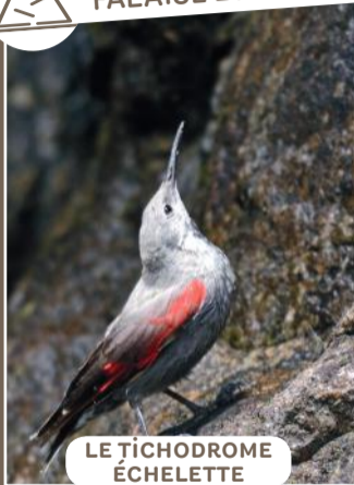
LE TICHODROME ÉCHELETTE