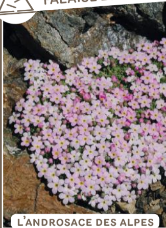
L'ANDROSACE DES ALPES