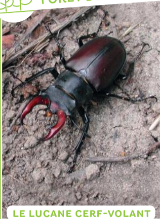
LE LUCANE CERF-VOLANT