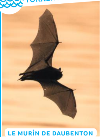
LE MURIN DE DAUBENTON