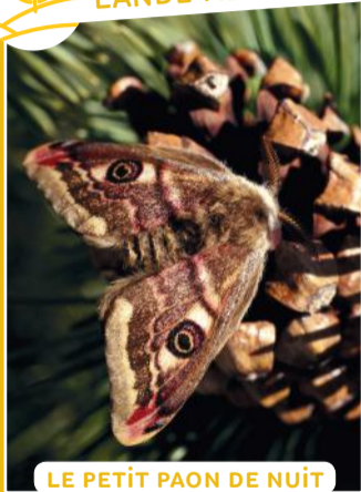
LE PETIT PAON DE NUIT