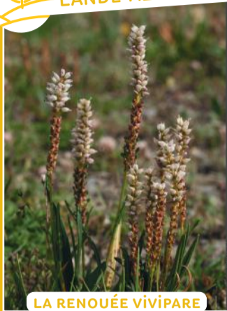
LA RENOUÉE VIVIPARE