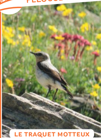
LE TRAQUET MOTTEUX