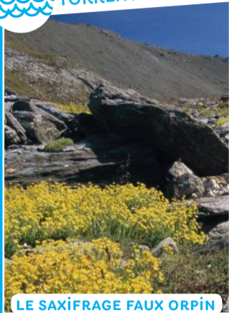
LE SAXIFRAGE FAUX ORPIN