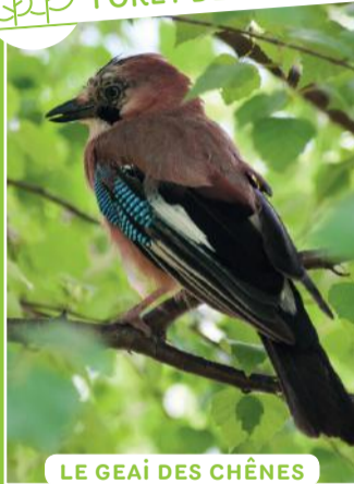
LE GEAI DES CHÊNES