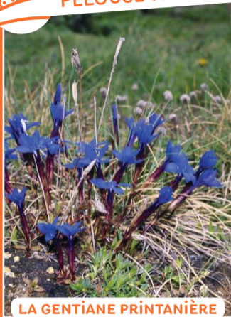
LA GENTIANE PRINTANIÈRE