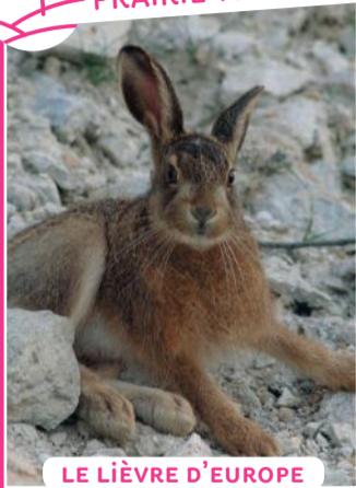
LE LIÈVRE D'EUROPE