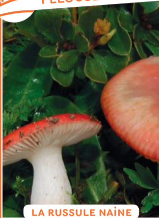
LA RUSSULE NAÏNE