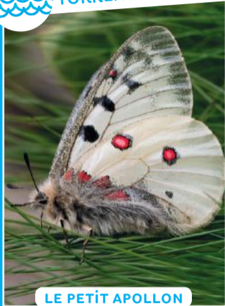
LE PETIT APOLLON