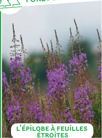
L'ÉPILOBE À FEUILLES ÉTROITES