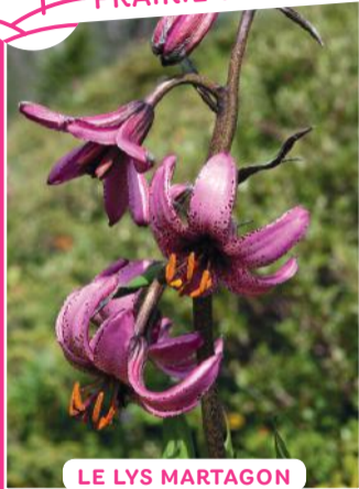
LE LYS MARTAGON