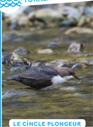
LE CINCLE PLONGEUR