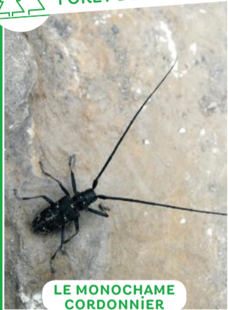
LE MONOCHAME CORDONNIER